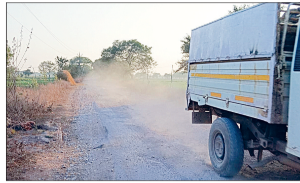
सालों पहले हुआ था निर्माण

कण उड़ रहे हैं। इससे लोगों का जीना मुहाल हो गया है। सड़क इतनी खराब हो गई है कि लोग दोबारा चलने के लिए सोचने को मजबूर हो गए हैं। वहीं चार पहिया वाहन चलने से सड़क धूल से भर जाती है, जिससे आमने सामने दिखाई तक नहीं देते। इससे दुर्घटना होने की बड़ी आशंका जताई जा रही है। सड़कों पर उड़ने वाली धूल कुछ सालों से मुख्य समस्या सुखियों पर है। हवाओं में धूल का स्तर बढ़ने से लोग परेशान हैं। धूल ▶▶ शेष पृष्ठ 13 पर